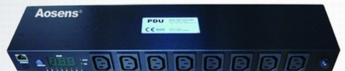
POM远程监控机柜插座PDU POM PDU