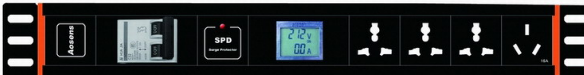
型号 Model: AS-1.5U-M3J1YFX 尺寸 Size: 430*66.6*66.6mm 额定电流 16-32A, 3位10A万用孔, 1位16A国标孔, 16-32A 2P空气开关, SPD防雷(浪涌)保护功能(带指示), 数显电流电压表 16-32Amp rated current/2 10-amp international outlets/1 16-amp Chinese outlets/One 16-32amp general control breaker /One SPD LED/ One digital current and voltage display