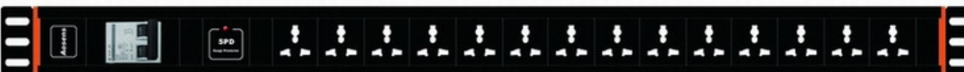
型号 Model: AS-1.5U-M14YF 尺寸 Size: 840*66.6*66.6mm 额定电流 32A, 14位10A万用孔, 32A 2P空气开关, SPD防雷(浪涌)保护功能(带指示) 32-Amp rated current/14 10-amp international outlets/ One 32-amp general control breaker/ One SPD LED