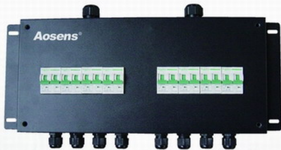
直流/交流空开PDU DC/AC breaker PDU