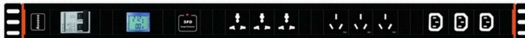
型号 Model: AS-1.5U-M3J3C3YXF 尺寸 Size: 920*66.6*66.6mm 额定电流 32A, 3位10A万用孔, 3位16A国标孔, 3位10A IEC60320-C13, 32A 2P空气开关, 数显电流电压表, SPD防雷(浪涌)保护功能(带指示) 32-Amp rated current/3 10-amp international outlets; 3 16-amp Chinese outlets/3 10-amp IEC60320-C13 outlets/ One 32-amp general control breaker/ One digital current and voltage display/ One SPD LED