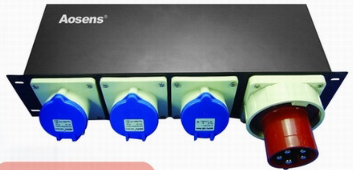
列头(工业)PDU Industry PDU