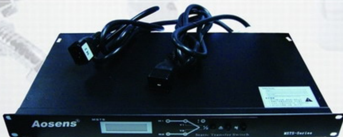
ATS双电源自动切换PDU Automatic Transfer Switch PDU